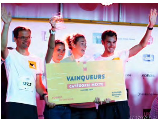
PODIUMS ET RÉCOMPENSES ÉQUIPES FEMMES / HOMMES / MIXTES