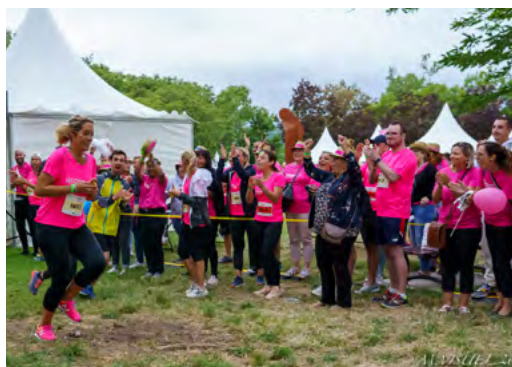
DES COLLÈGUES SUPPORTERS