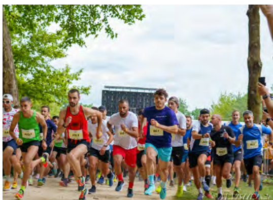
DÉPART DE LA COURSE