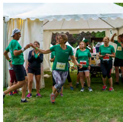
AU PLUS PROCHE DE VOTRE TENTE