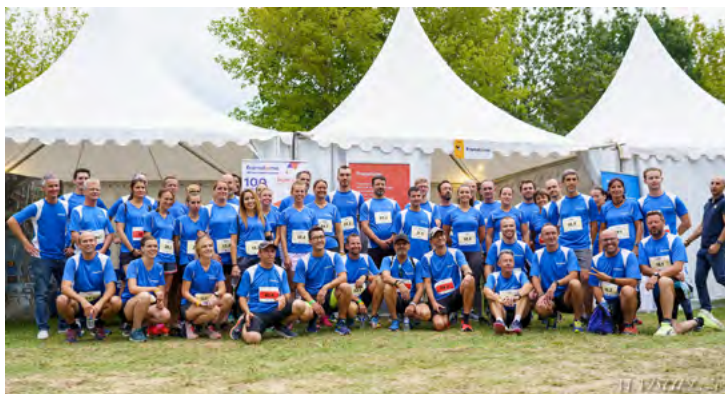
FRAMATOME ET SES 14 ÉQUIPES EN 2022 À VALENCE