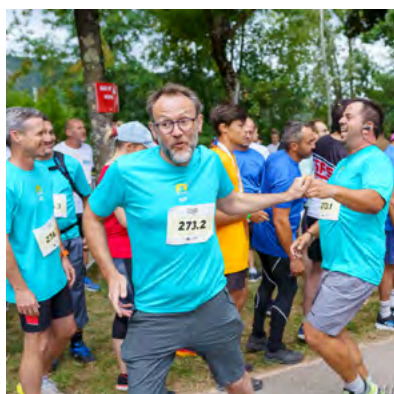
PASSAGE DE RELAI