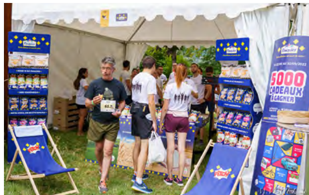
ANIMATION DE PASQUIER SUR LE VILLAGE